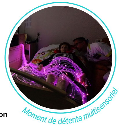
Moment de détente multisensoriel

Cette formation a été dispensée auprès du personnel de jour et de nuit.