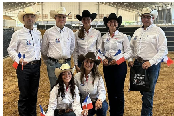
Les jeunes cavaliers entourés du Manager et du Coach