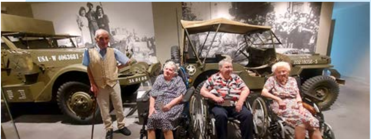
Certains résidents se sont replongés dans l'histoire, en visitant le musée de la Résistance à Saint-Marcel, au cœur même de la deuxième Guerre Mondiale.