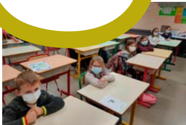
Conseil des délégués