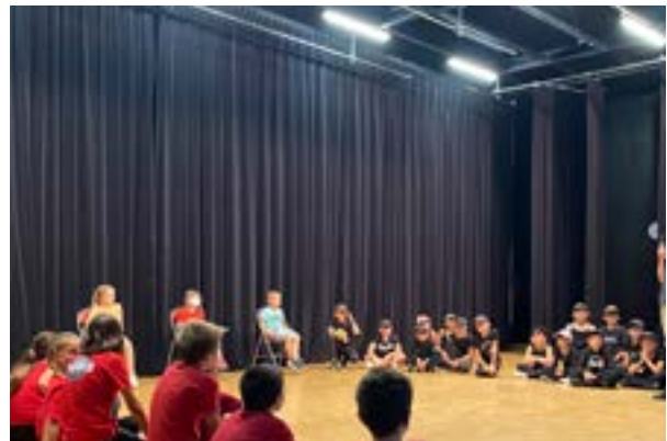
Dans la bienveillance et sous les encouragements de tous, les élèves se sont affrontés lors de battles entre classes.