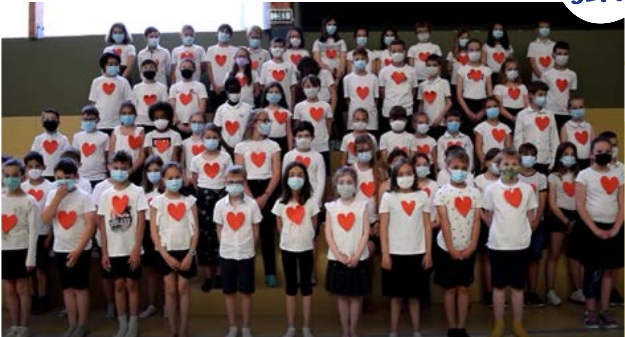
St Guérolé en coeur Classes de CE2 CM1 CM2