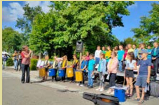
Participation des élèves volontaires de CE2, CM1 et CM2 à la fête de la musique. Présentation d'extraits de la Batucada de l'école