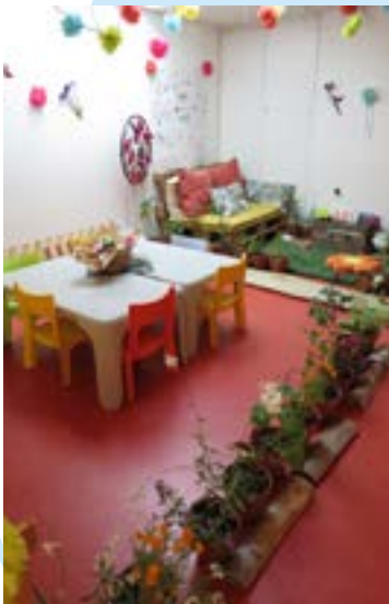
Univers nature et floral