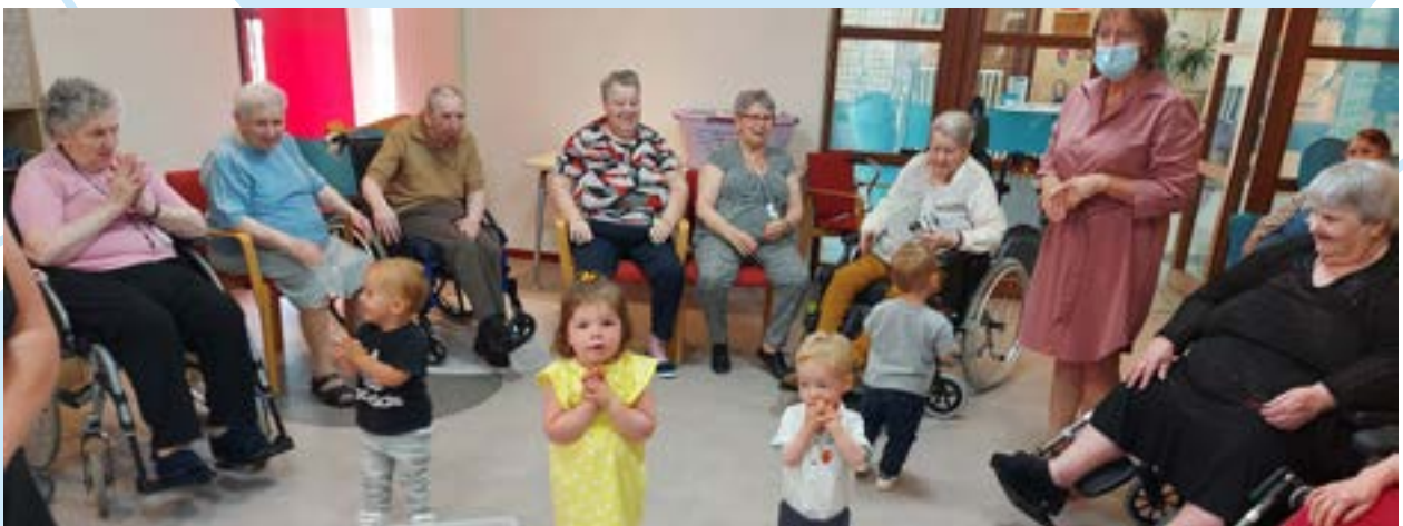
Pour le plus grand bonheur de tous, les enfants ont fait leur retour à l'Ehpad ! Pour une après-midi, les résidents ont retrouvé leur jeunesse. La salle s'est remplie de jeux et de rires.