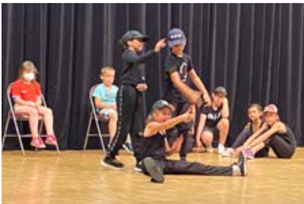
Les élèves sont passés tour à tour par petits groupes ou individuellement pour proposer la chorégraphie qu'ils avaient inventée à partir de tout ce qui a été vu lors des 10 séances de travail.