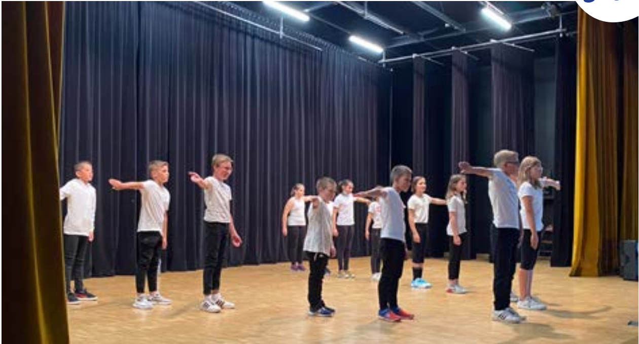
Spectacle de Hip Hop à la salle des Lavandières le lundi 4 juillet