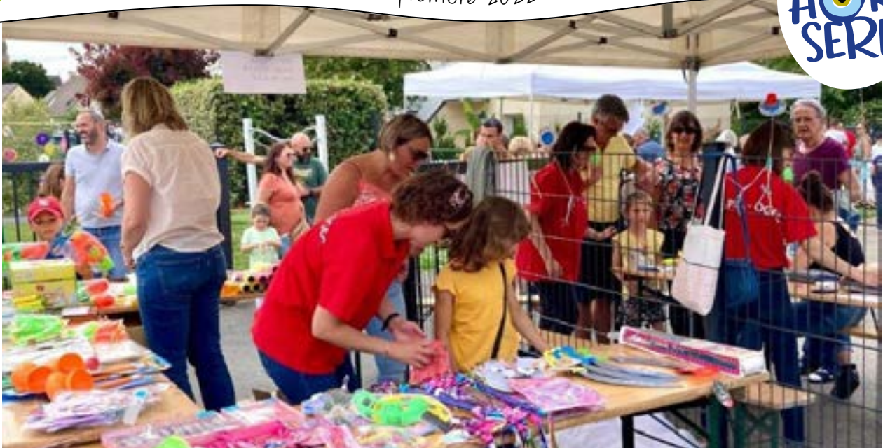
Kermesse de l'école