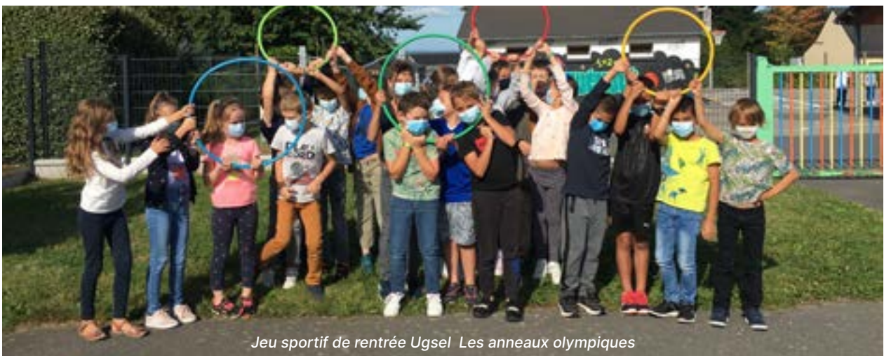
Jeu sportif de rentrée Ugsel Les anneaux olympiques