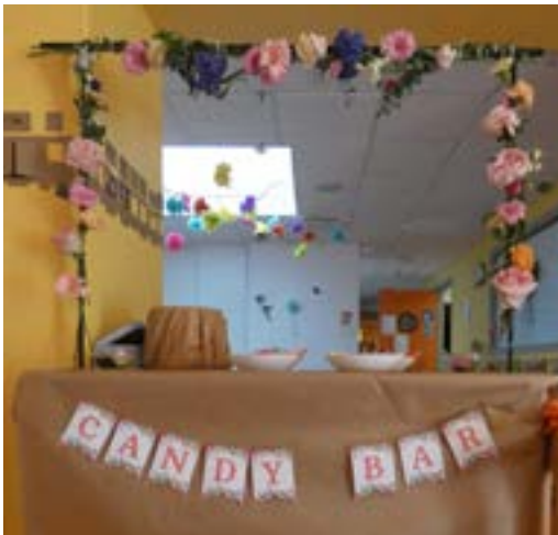
Candy bar animé par Chloé