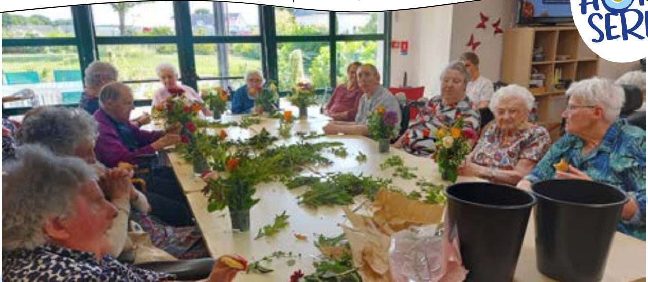
Pour fêter le printemps, les résidents ont assisté à un atelier art floral. Les belles compositions préparées ont permis de décorer la résidence pendant quelques jours.