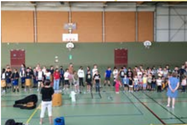
Répétition générale de la Batucada pour la kermesse