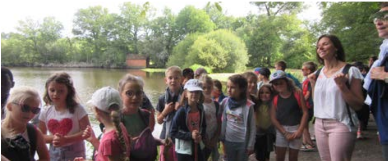
Journée randonnée jeudi 5 juillet pour tous les élèves du CP au CM2