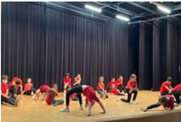
Les élèves des classes de CE2-CM1 et CM1-CM2 ont présenté leurs chorégraphies devant leurs familles.