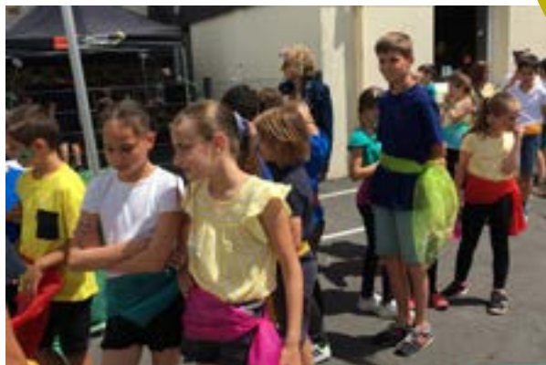
Départ de l'école pour le spectacle de la kermesse