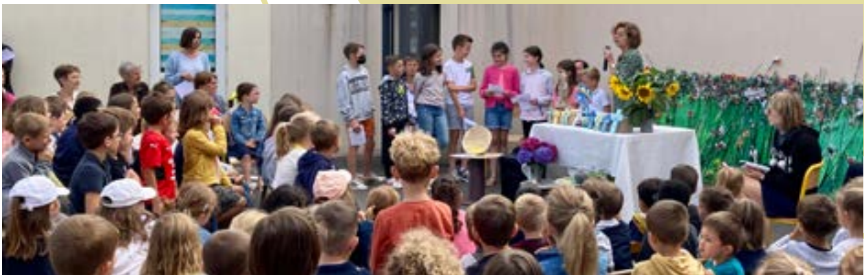
La bénédiction de la nouvelle école maternelle et l'envoi des CM2 au collège. Chaque élève de CM2 s'est vu remettre une clé USB avec le logo de l'école