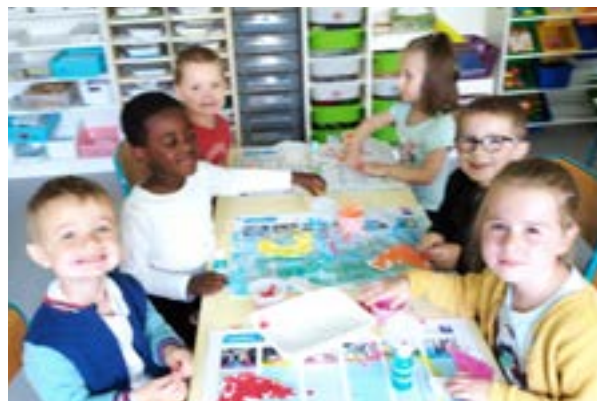
Journée fraternité en maternelle