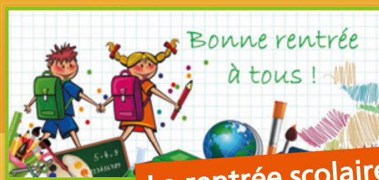
La rentrée scolaire