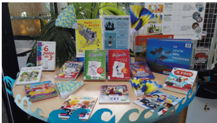
Première Participation à « Partir en livre », fête nationale consacrée à la littérature jeunesse.