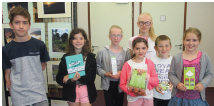
Les grands gagnants des quizz sur la bibliothérapie et la nature.