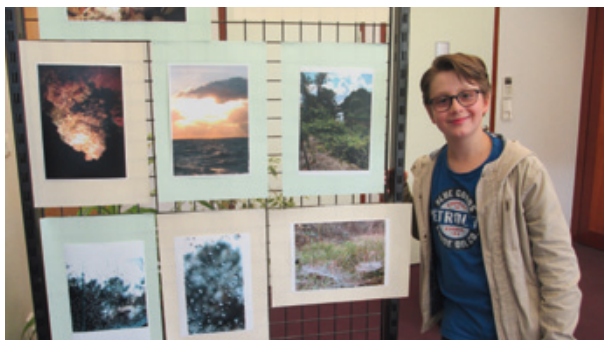
Exposition photos « Nature et Patrimoine » présentée par Malo Hyron.