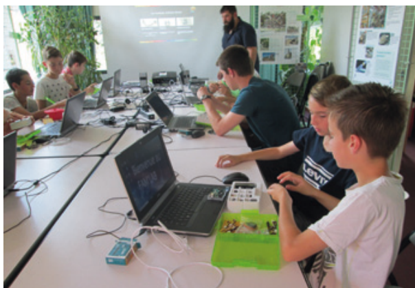
Atelier Fablab : programmation électronique dans l'optique de la construction d'un robot.