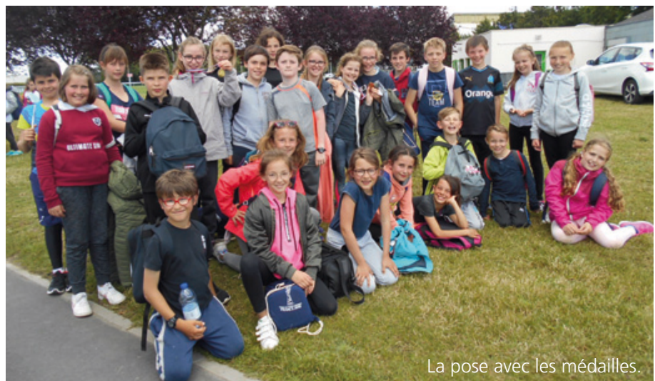
La pose avec les médailles.

La première, encadrée par des bénévoles de la ligue de football, s'est déroulée à Rennes lors d'un rassemblement inter-écoles au cours duquel les enfants ont pu participer à une course d'orientation sur le thème de la coupe du monde puis à des ateliers/jeux avec beaucoup de glissades (pluie) et enfin à un tournoi à 5 contre 5. Les enfants ont effectué de grands progrès tout au long des