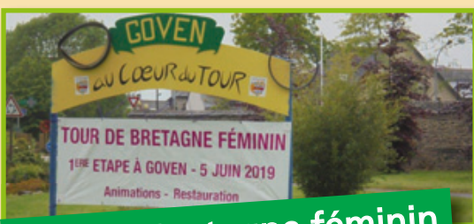
Tour de Bretagne féminin