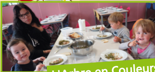
L'Arbre en Couleurs