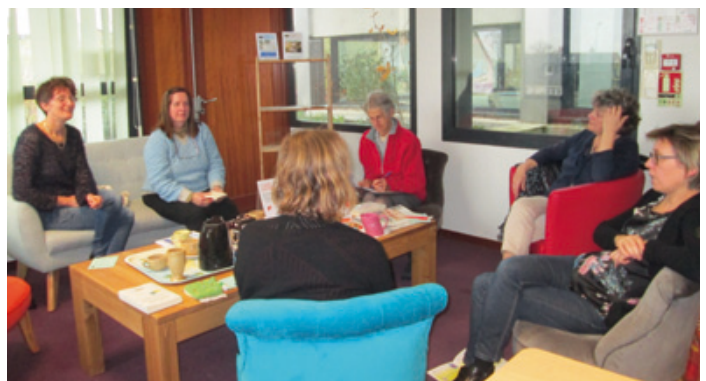
Café littéraire : échange et partage de lectures dans une ambiance chaleureuse.