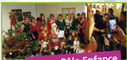
Espace Pôle Enfance