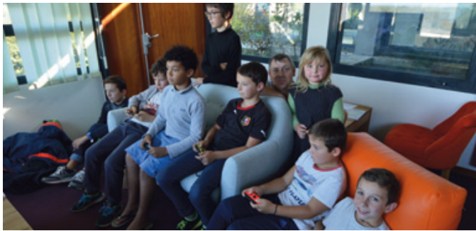
Un après-midi Jeux vidéo et Jeux de société autour des légendes.