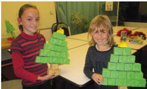
Fabrication d'un calendrier de l'Avent.