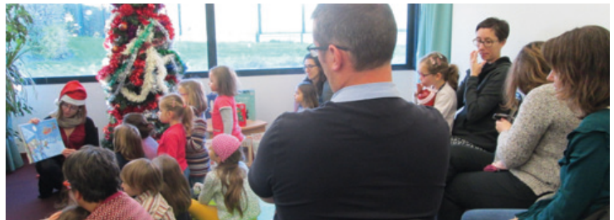
Heure du conte pour les 3-6 ans.