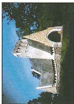
PATRIMOINE Chapelle de l'Hermitage